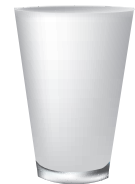
Vaso o taza