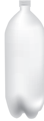
زجاجة بلاستيكية فارغة بغطاء