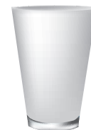
Стакан или чашка