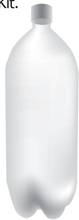
Пустая пластиковая бутылка с пробкой